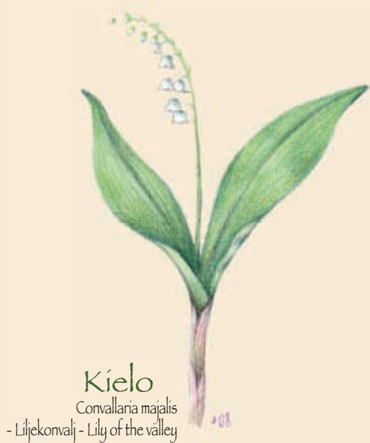
Kielo Convallaria majalis - Liljekonvalj - Lily of the valley