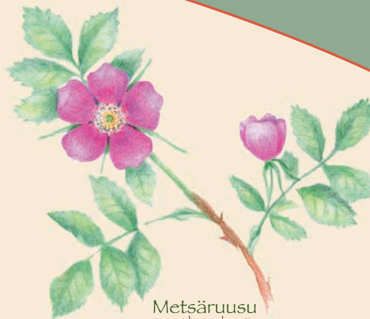
Metsäruusu Rosa majalis - Kanelros - Cinnamon rose

Vaatelaita lajeja ovat mm. näsiä, lehtokuusama, kivikkoalvejuuri, taikinamarja, koiranheisi, kotkansiipi, mustakonnanmarja, kurjenkello, keltasara, kevätlinnunherne ja kalliokieli. Myös linnusto on runsas ja monilajinen. Alue on mm. pyyn, metson, palokärjen, ampuhaukan, viirupöllön, huuhkajan ja pähkinähäkin elinympäristöä