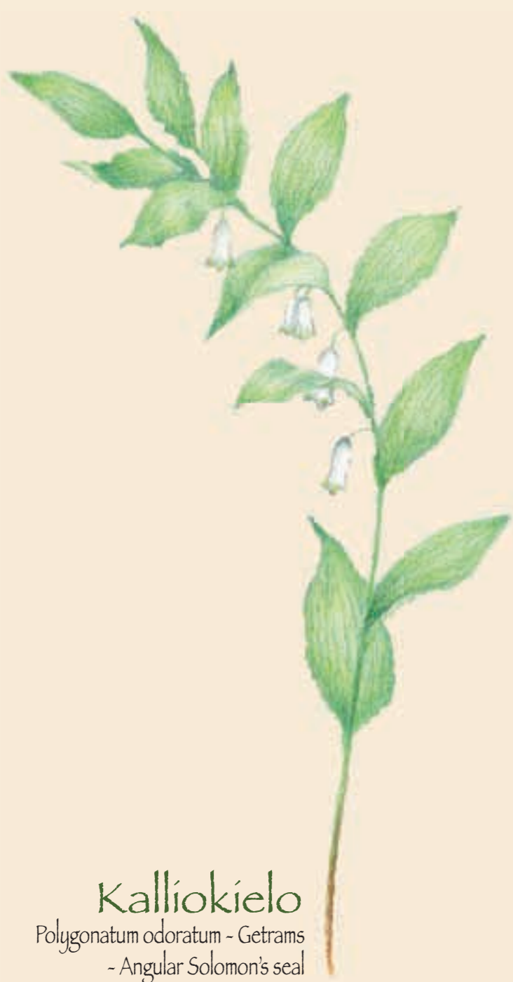
Kalliokieli Polygonatum odoratum - Getrams - Angular Solomon's seal