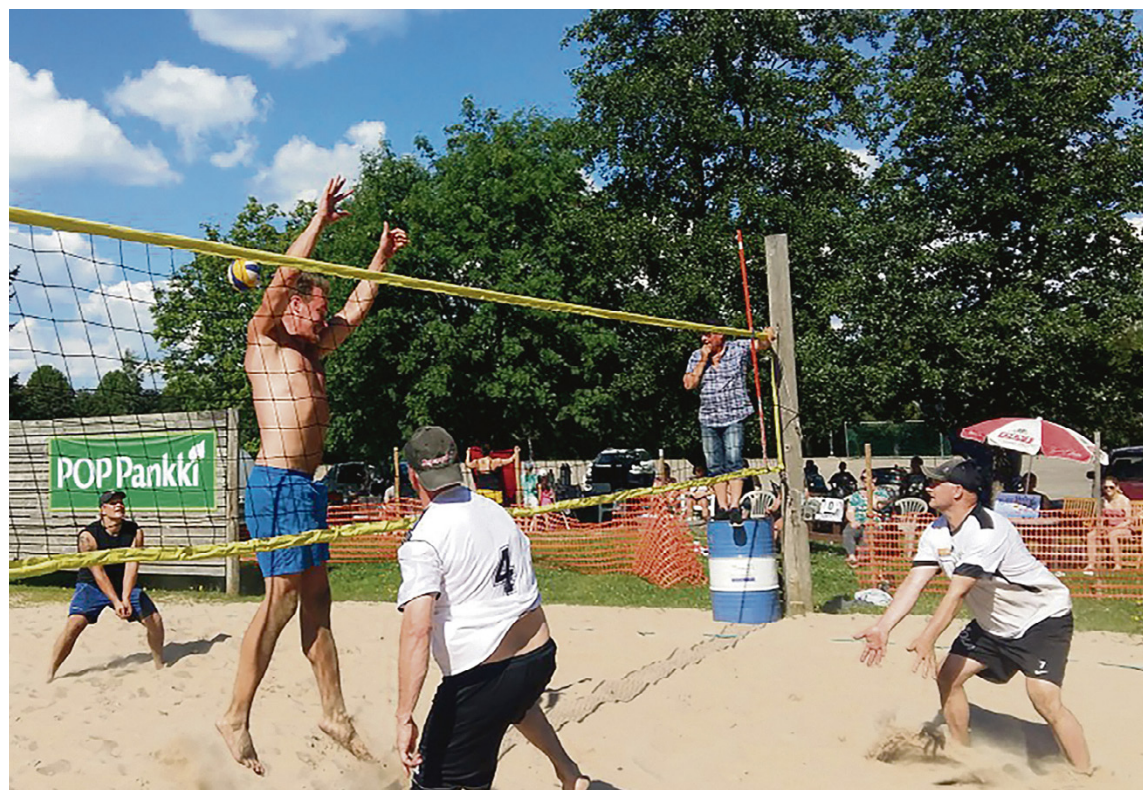
Ruhaassa lentopalloviikettä tarjoillaan talvella kyläkoulun liikuntasalissa ja kesällä ulkokentällä. Kesän beach volley -turnaus on jo käsite. Silloin väki kokoontuu nauttimaan kesästä, lajista ja tunnelmasta.