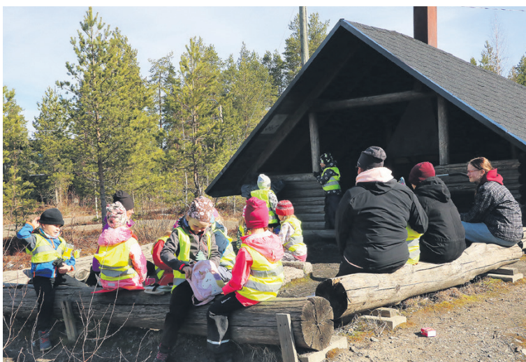
Liuhtarin päiväkodin Hapero-ryhmä lasten toiveesta luontoretkellä Ritavuoren laavulla.

- Vuorovaikutustaidot kehittyvät arjen toimissa, kun lapsia ohjataan huomaamaan näitä tärkeitä, hyviä asioita. Tähän tarvitaan opastusta. Me harjoittelemme näitä taitoja mm. tervehtimällä, puhumalla kauniisti, pyytämällä ja antamalla anteeksi, Takaluoma luettelee pie-